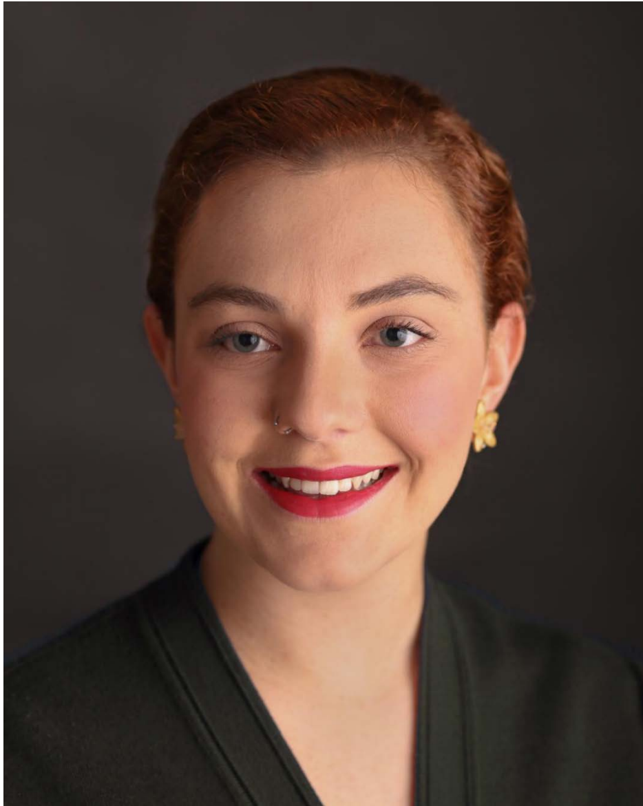
EVA PERÓN (1919-1952) / Política y actriz argentina

34 mujeres de CUEVAS DE SAN MARCOS se han metido en la piel de mujeres que marcaron Historia: Clara Campoamor, Victoria Kent, Marie Curie, Maruja Mallo, Frida Kahlo, Cleopatra, Hipatia, Maria Callas, etc.