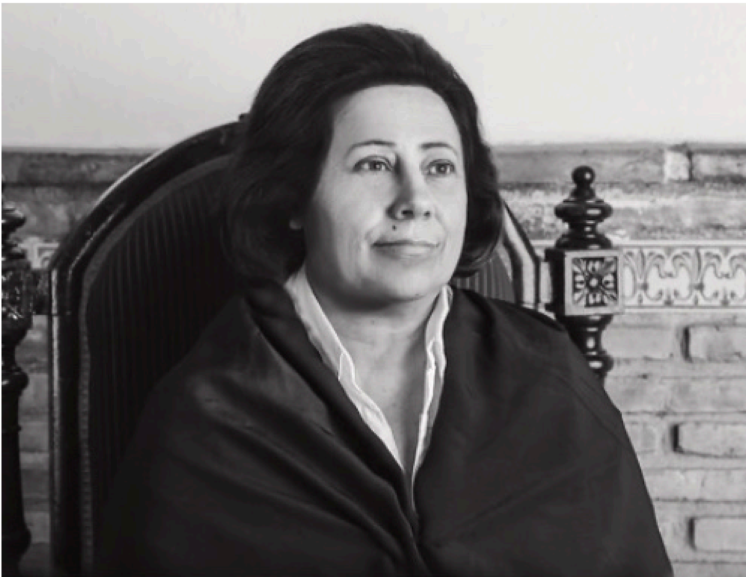
VICTORIA KENT (1891-1987) / Abogada y política republicana española, nacida en Málaga

Os invitamos a poneros piel con piel con aquellas mujeres cuyos nombres usamos ahora como banderas: en sus ojos brillan los tuyos, de su fuerza sois las legítimas herederas.