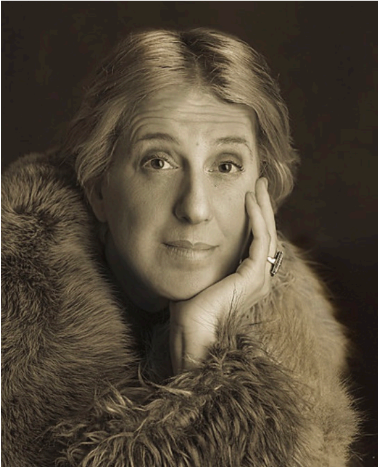
VIRGINIA WOOLF (1882-1941) / Escritora británica e influyente feminista