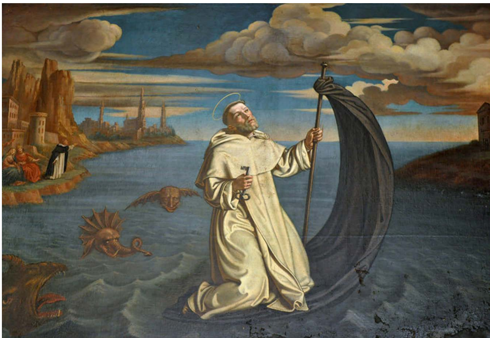
San Ramón atravesando el Mediterráneo desde Baleares a Barcelona (TOMÁS DOLABELLA)