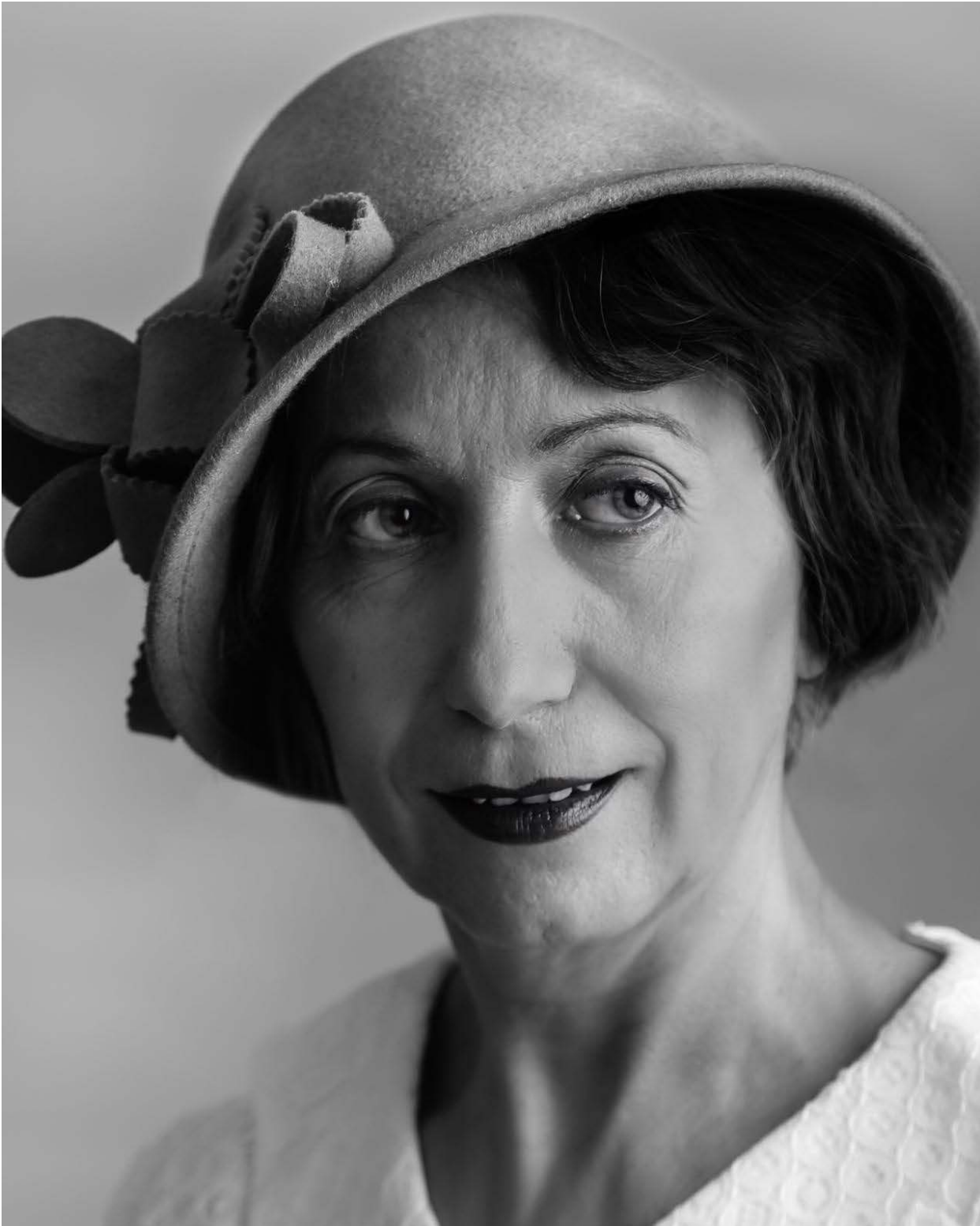
MARÍA LUZ MORALES (1889-1980) / Periodista y escritora española