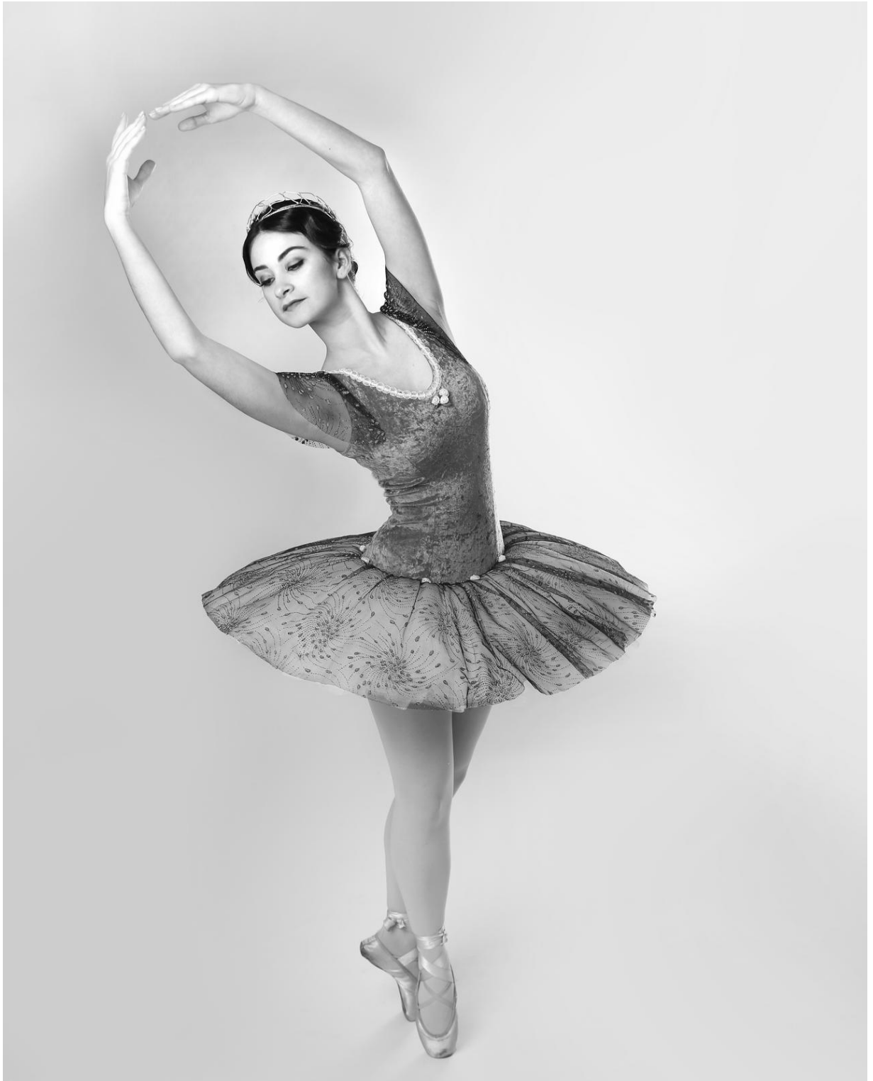
ALICIA ALONSO (1920-2019) / Bailarina y coreógrafa cubana